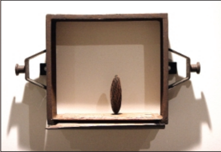
Voca me 2005

El debate sobre la exposición Tiempo de sibilas de Josep M. Camí, se centró en la importancia de recuperar un arte de denuncia, solidario y con una preocupación auténtica que revaloriza el papel de las mujeres «sibilas». Una mirada crítica contemporánea que convierte al artista en el oráculo que hace un análisis reflexivo sobre lo que él mismo siente y piensa.